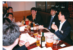
Bブロックの“精鋭”たち

今期は東青協議員の改選があり、初めて参加される方もいたためか、まったく“堅い”雰囲気はありませんでした。「まずはみんな仲良くなろう」という感じで、初めて参加する私もあまり緊張することなく、いろいろな方と話すことができました。これを機に東青協の活動にもなるべく出席して、他支部のみなさんとも交流を深めながら次に繋げていけるようにしたいと思います。