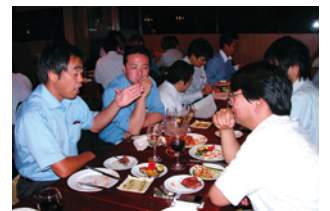
盛り上がってます!