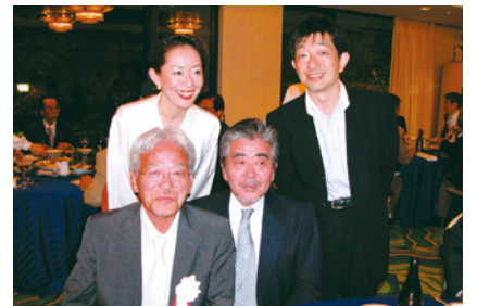
総会後の懇親会にて

手前味噌になりましたが、最後に発行にご協力いただきました協賛各社に心より感謝いたします。今後ともよろしくお願ひいたします。