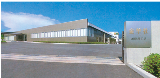
金羊社・御殿場工場外観

最後に。大変勉強になる工場見学でしたが、ひとつだけ心残りが。というのも、この御殿場工場は撮影禁止だったのです。情報管理のためとのことですが、この欄で写真とともに説明できなかったことが残念です。。。